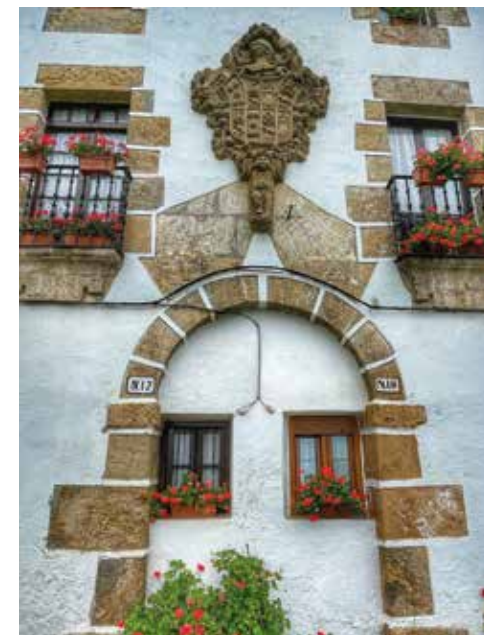
Aginaga baserriko armarría eta eguzki-erloju.

Alkiza. Hiru dira Alkizako herriguneko monumentuak: XVI. mendeko San Martin eliza gotikoa, barne egiturari Erdi Aroko hainbat elementu dituen Alkizalete baserriaren eraikin barrokoa eta Santiago ermita, 1528an lehen aldiz aipatua, zeinak hilerriarekin batera multzoa osatzen duen. Aipatzekoak dira ere, Alkizako hainbat ondasun etnografiko, hala nola, Berandoain, Basazabal, Zumitza eta Intxarraundiagako karobiak, Altzor-