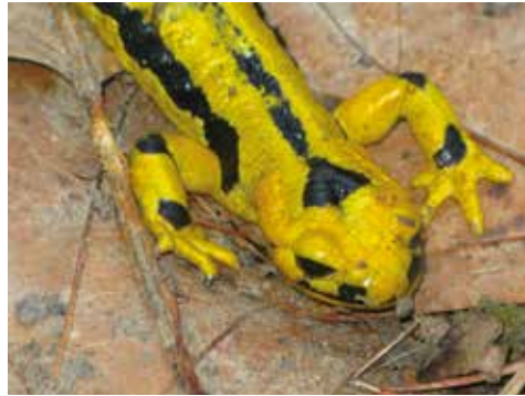
Arrabio arrunta ( Salamandra salamandra ).

Harkaiztia hegazti sarraskijaleen habitata da. Aipagarria da espezie asko Europa zein Euskal Herriko katalogoetan jasota daudela, hala nola: sai arrea ( Gyps fulvus ), sai zuria ( Neophron percnopterus ), mendi tuntuna ( Prunella collaris ), belatz gorria ( Falco tinnunculus ) edo belatzingak ( Pyrhonorax sp. ). Halaber, eremu horretan zenbait hegaztiren biziraupena eta ugalketa ere bermatzen da (sai arrea eta sai zuria, besteak beste). Horretarako habia egiten duten tokiak babesten dira eta elikatzeko eremua zaintzen da (larreak eta sastrakak).