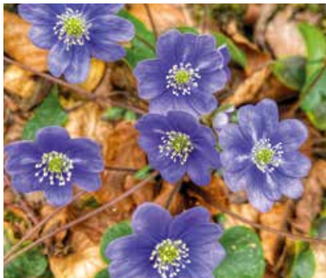
Gibel-belarra ( Hepatica nobilis ).

Paisaia horietan mehatxatutako fauna espezieak bizi dira: hildako egurrean bizi diren intsektu deskonposatzaileak, kiropteroak (saguzarrak) eta hegazti sarraskijaleak (sai arrea eta sai zuria).