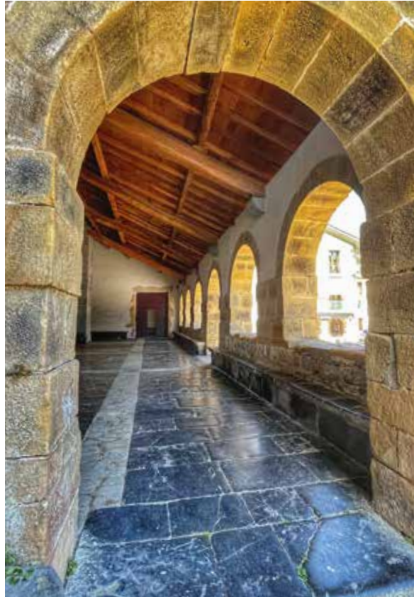
San Esteban elizako arkupea.

Eraikin erlijioso ugari ditu Tolosak bere auzoetan sakabanaturik: estilo neoklasikoko San Joan kapera (1850) Arramele auzoan, XVII. mendeko San Frantzisko eliza eta komentua, klaratar mojen XVIII mendeko zenobio barrokoa den Santa