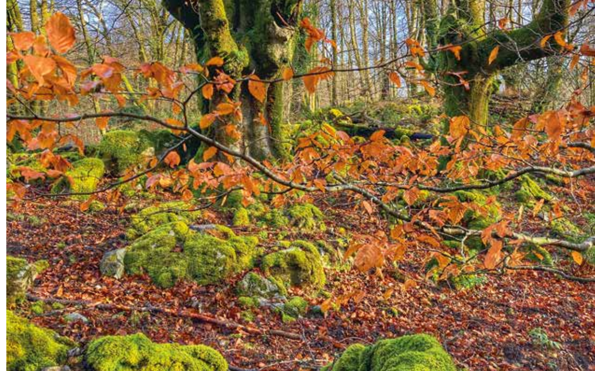
Pago enborrak udazkenean.

Landaretzari dagokionez, baso hosto-erorkorrek dira zabalenak. Basoen artean pagadiak dira nagusi, eta azidofiloak dira azpimarratzeak. Balio ekologiko handiko baso helduen eta pago-motz unadak ere agertzen dira. Beraz, esan daiteke, garai batean izan zen egurraren ustiake-