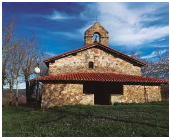
Ermita de San Lorenzo o San Lorente, antes de llegar a Zumaia.

Km 32,73: La pista se incorpora a otra junto a una chabola blanca (147 m) y giramos a izquierda, al encinar.