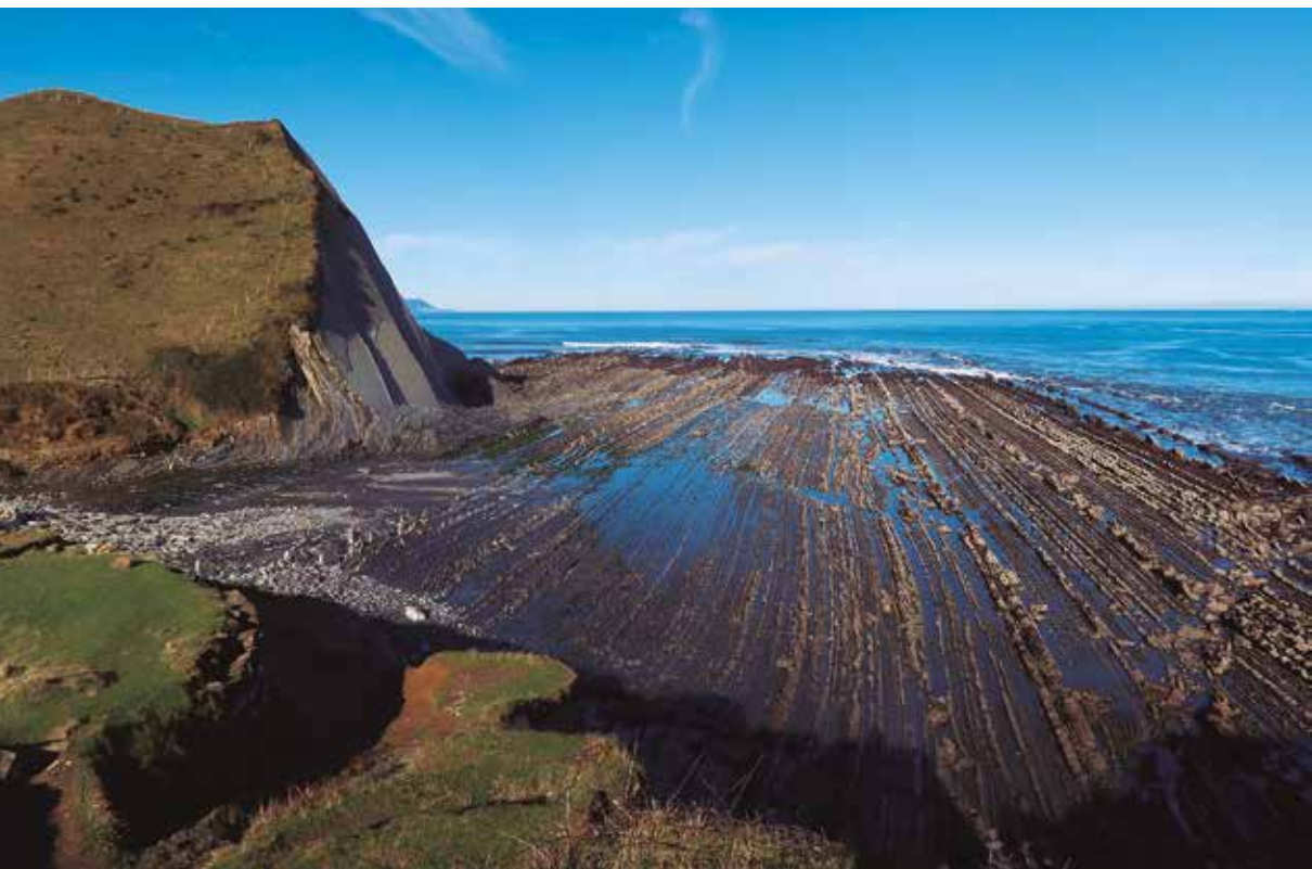
Sakoneta, la joya del flysch.

Las localidades costeras de Mutriku, Deba y Zumaia, conforman el Geoparque Unesco de la costa vasca; un paraje sin igual que esconde en los estratos del flysch más de 50 millones de años de historia. Resulta impresionante ver cómo los pliegues de la tierra se vuelven casi verticales en los acantilados que caen doscientos metros sobre el mar.