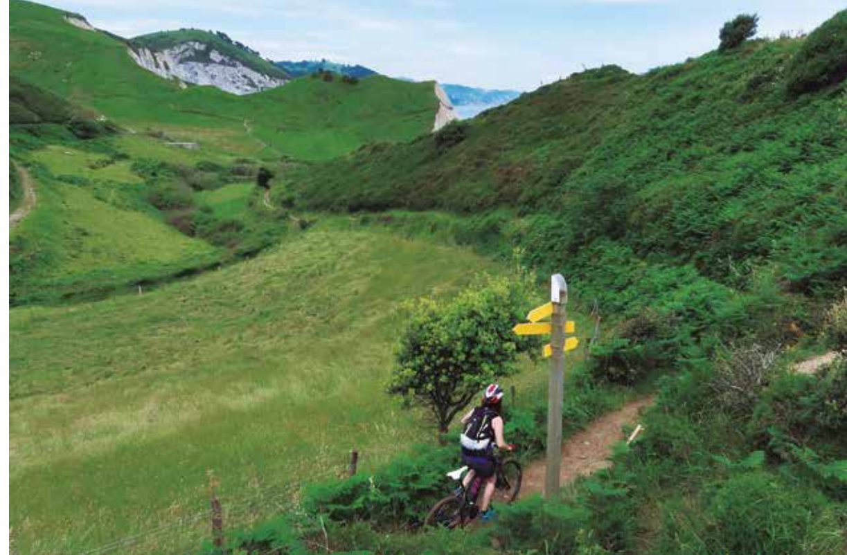
Un pequeño verde y encajonado valle es la antesala al espectáculo de Sakoneta.

Km 33,37: A la altura de una señal de límite 20 km/h, por la pista izquierda.