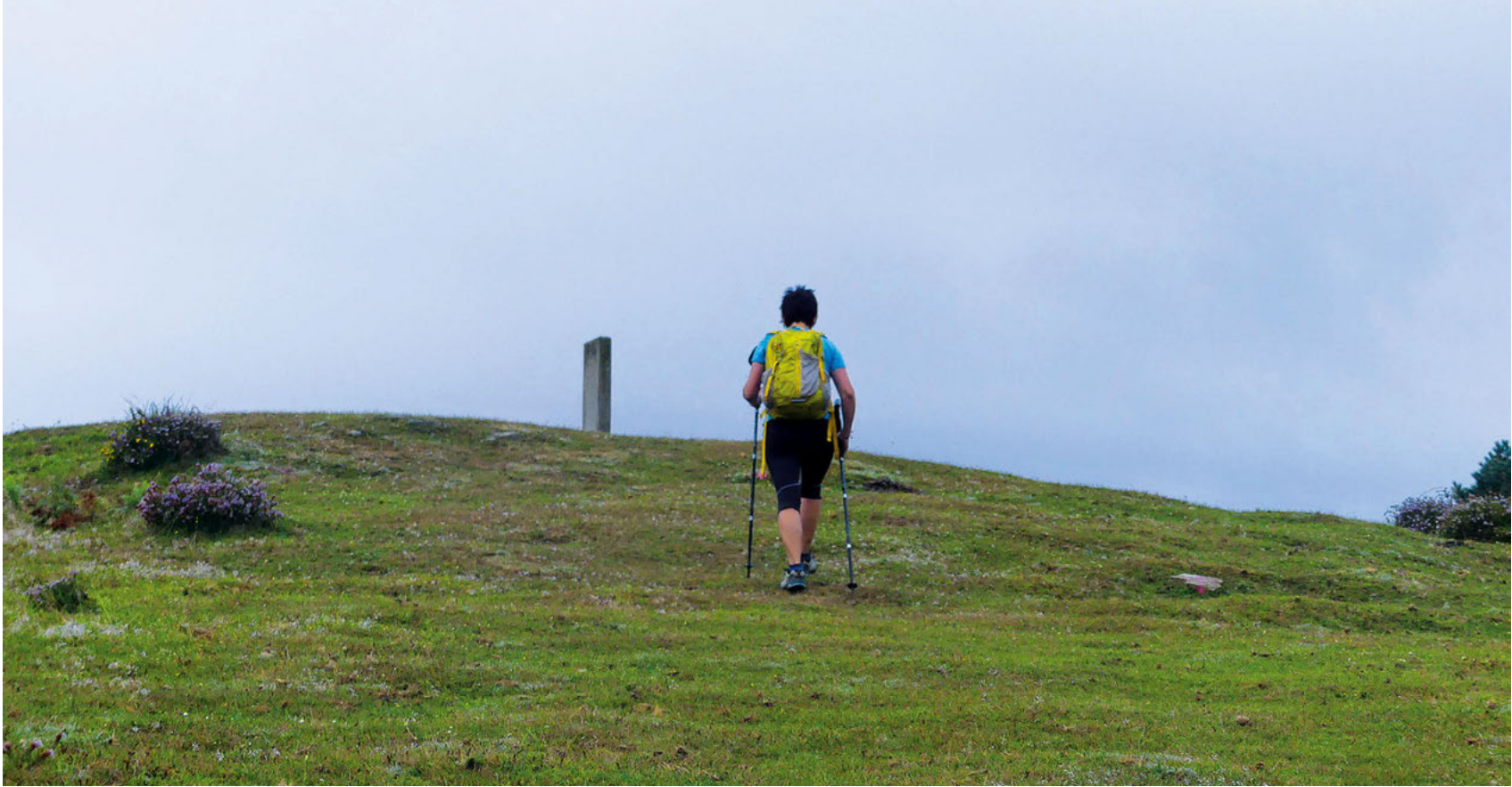
La cima de Otañu es una amplia loma herbosa.

medio del pinar llegamos hasta la borda de Zabarrain, en la que convergen los límites de los municipios de Zerain, Mutiloa y Legazpi. Desde este punto, una senda que asciende por la loma nos lleva directamente hasta la despejada cima de Otañu (838 m – 1 h 45 min). La cumbre es una amplia campa con un monolito y un buzón en forma de cohete en el centro. Las vistas a nuestro alrededor son magníficas. Podemos identificar algunos montes como Larrunarri-Txindoki, Beriain, todo el cresterío de Aizkorri y Aloña, Udaltx, con el Anboto detrás, Korosti, Hernio y hasta Aiako Harria, en el extremo norte del territorio guipuzcoano. Para continuar con la ruta circular, descendemos hacia el sur por un sendero con