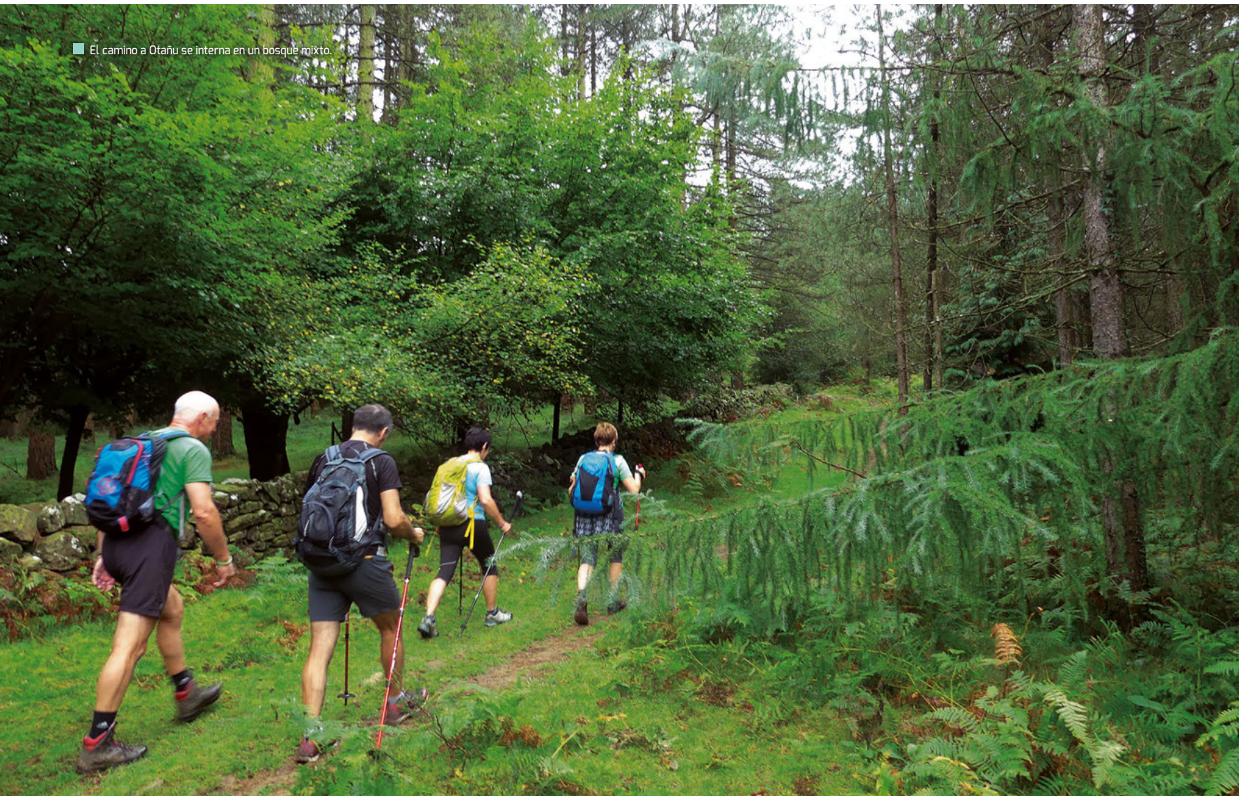
■ El camino a Otañu se interna en un bosque mixto.

Descendemos por Brinkola y Telleriarte. ■