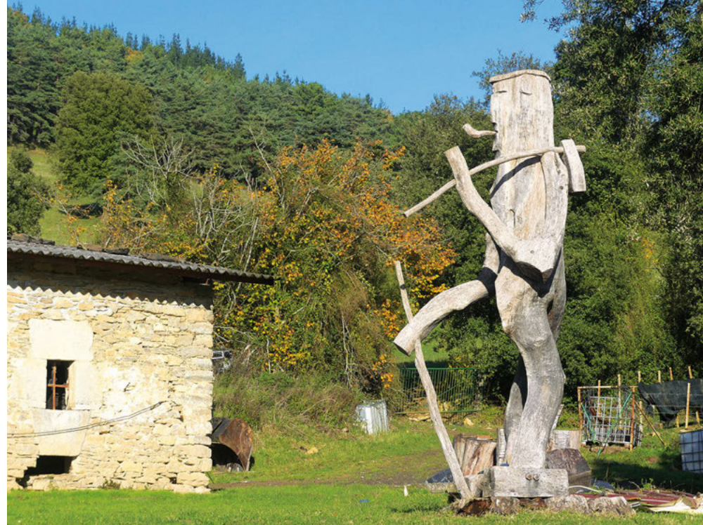
■ Escultura de madera en la granja de Las Campas.

agricultor, alcanzamos un portillo en medio del pinar, desde el que descendemos a un amplio cruce de pistas. La de la derecha comunica con el alto de Los Heros, en la carretera entre Artziniega y Balmaseda, así que optamos por tomar la pista de la izquierda. Nuestro objetivo es recorrer toda la ladera oriental de la montaña hasta ubicarnos en la vertiente sur; desde donde continuaremos hacia la cima. Descartamos los desvíos que salen al paso antes de alcanzar ese punto. Una vez en el cruce, el camino que sale por la derecha nos lleva por el alto del cordal hasta las antenas que coronan la cima del monte Montenegro.