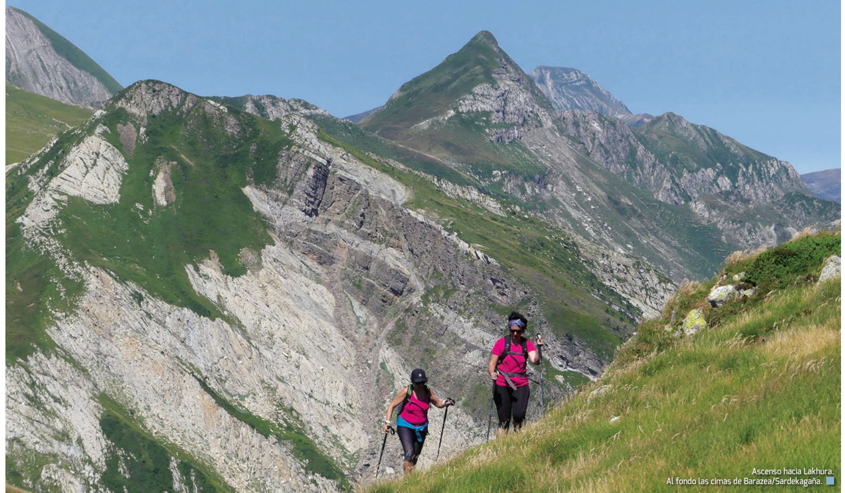
Ascenso hacia Lakhura. Al fondo las cimas de Barazea/Sardekagaña.

Esa inspiración en la naturaleza nos ha dado la pista necesaria para conocer mejor nuestro territorio y crear itinerarios de ida y vuelta por caminos diferentes y de esta manera aprovechar al máximo las posibilidades que nos ofrecen estas excursiones a lo largo y ancho de Euskal Herria. Dicho de una forma más gráfica y resumida, la idea sería unir el punto final de la línea con el principio del re-