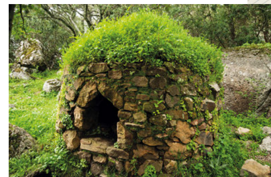
Horno de pan al final del sendero.

Es un bonito sendero perfecto para hacer con niños que no reviste ninguna dificultad. Suele añadirse como visita adicional a alguna de las rutas cercanas como Risco Blanco o el Arco del Niño