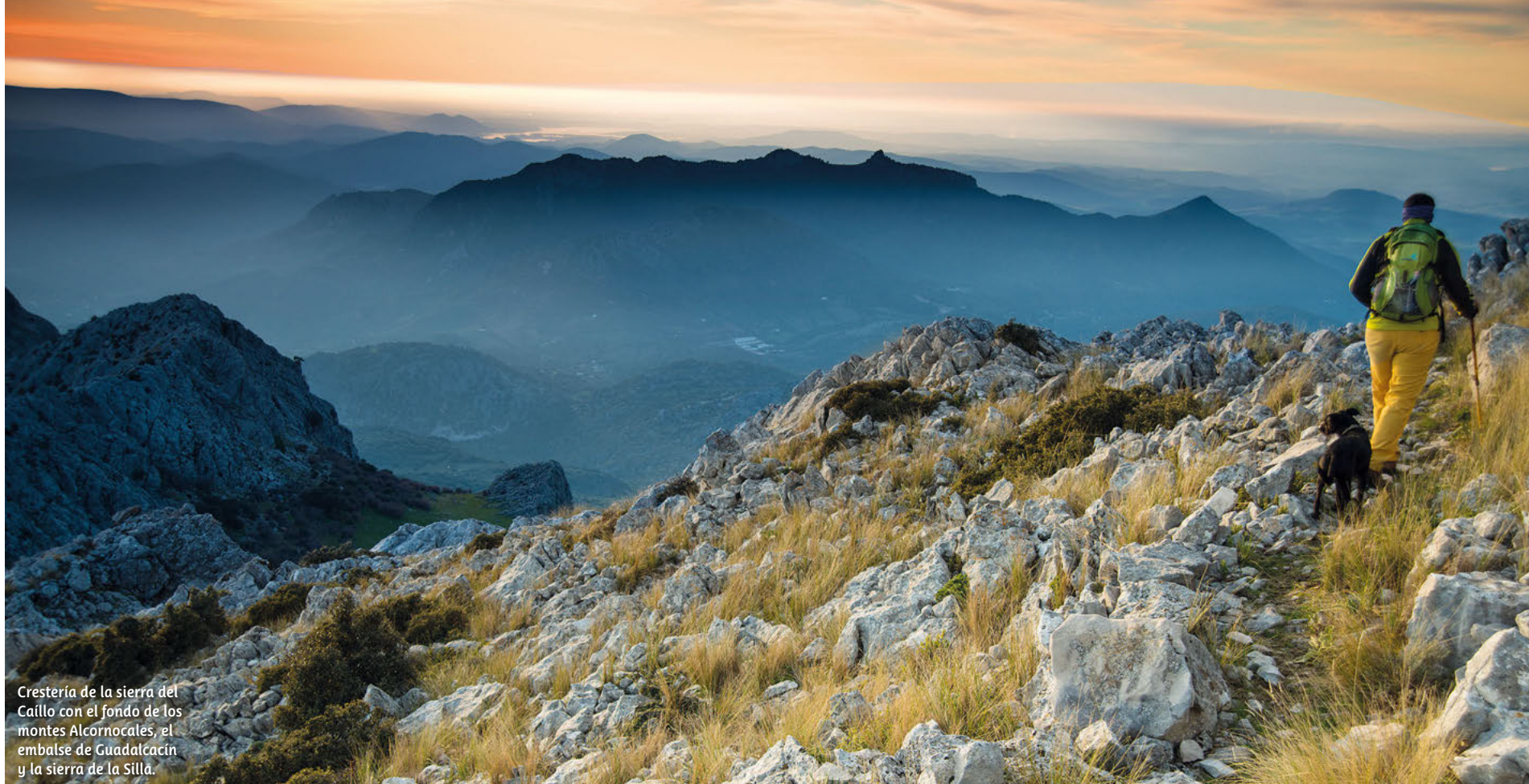
Crestería de la sierra del Callo con el fondo de los montes Alcornocales, el embalse de Guadalcacín y la sierra de la Silla.

Cádiz posee tres paisajes fundamentales que determinan su identidad cultural, patrimonial y como no el aspecto turístico: la costa, la campiña y la montaña.