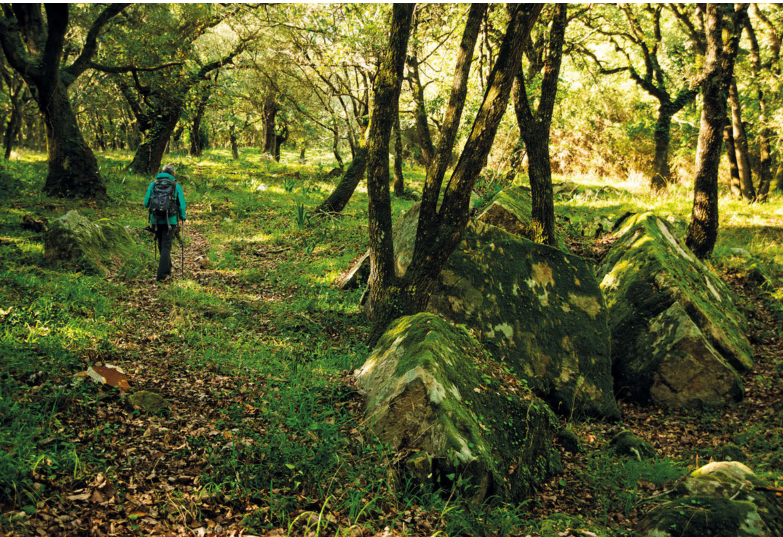
Quejigal tras la subida del río.

ellos es el helecho conocido como calaguala, propio de regiones tropicales. Aquí los árboles están tapizados de musgo de color verde intenso y llama poderosamente