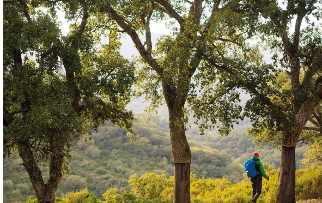
Alcornocales pelados cerca del río Hozgarganta, escenario de las mejores rutas de el parque natural de Alcornocales.

Como resumen y a pesar de que encontraremos que en Cádiz todo el mundo entiende de vientos “mañana soplará poniente”, “ tres días de levante, sino para ahora, no lo hará hasta dentro de otros tres...” “esta brisa trae agua”. La realidad es que resulta complicado acertar un pronóstico del tiempo y sus vientos. Lo que hay que tener claro es que si nuestra visita está enfocada al senderismo, debemos descartar los meses de junio a septiembre. Categóricamente. Las temperaturas son elevadas haga el viento que haga. El mes más caluroso es julio y la primera quincena de agosto no se queda corta. En ciertos días se alcanzan temperaturas de hasta 40 grados. Si a ellas se le añade un viento de levante o sur el calor es asfixiante. Si estamos en la zona en este periodo y queremos aprovechar, tendremos ventaja con alguna jornada en la que sople poniente, que puede hacer bajar la temperatura de un día para otro más de 15 grados, lo que nos permitirá afrontar alguna ruta de la costa y como mucho algún sendero oculto por bosque.