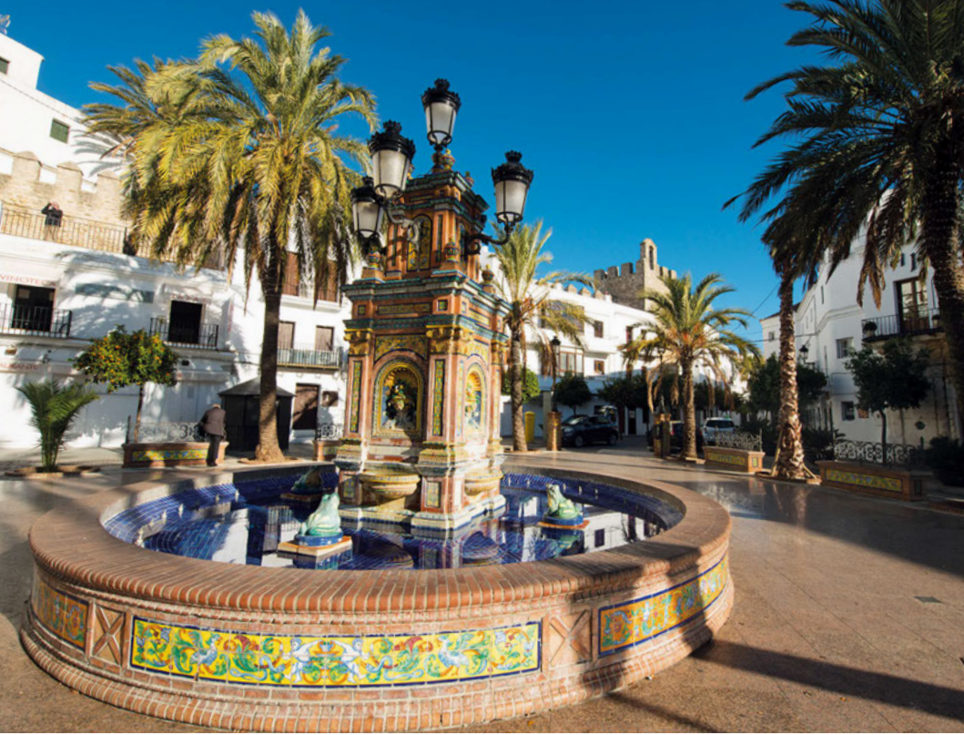
Fuente de los pescaitos en la Plaza de España.

casas con patios. Eran las antiguas casas vecinales. Patios con arcos alrededor. Muchas con un pozo comunal en el centro, que algunas conservan. También con un baño común en una esquina del patio. En primavera muchas de ellas optan al premio del mejor patio. Con sus cuidadas flores y plantas, la mayoría gitanillas, margaritas y aspidistras repartidas por las fachadas interiores en toda suerte de macetas.