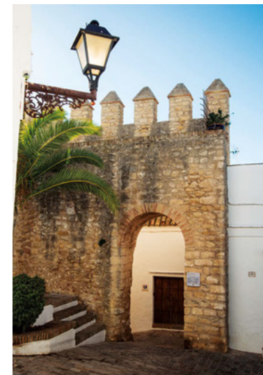
Arco de Puerta cerrada, una de las entradas a la muralla.

Las mujeres cobijadas es posible verlas en la inauguración de la Feria de Primavera y en la fiesta de la Patrona