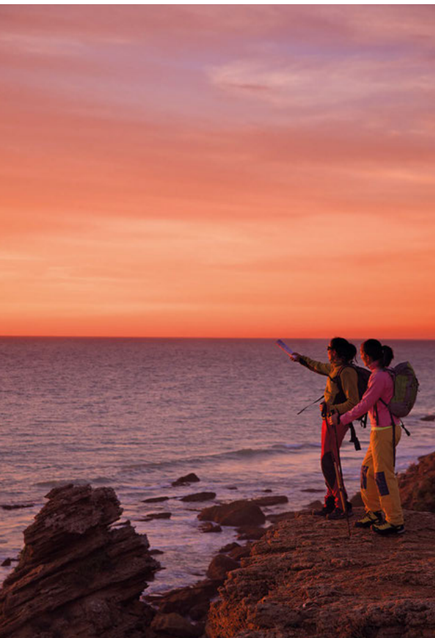
Acantilados en las canteras romanas de Punta Camarinal.

su excepcional carne— y de algunos de las mejores razas de caballos del mundo. Esta geografía de suaves lomas puede recorrerse por las rutas del vino o la del Toro... ventas típicas de carretera y pueblos con fuertes sellos de identidad histórica como Medina Sidonia, que se cuenta como uno de los lugares con mayor número de vestigios históricos de diversas culturas hallados en la provincia. Es un pueblo con encanto, como lo son los pueblos blancos. Una etiqueta real y exquisito baluarte de la vida rural. Sus pueblos se extienden desde las colinas de la campiña, con representantes como Olvera, Arcos o Bornos hasta ir escalando el paisaje más desconocido de Cádiz: la montaña . Aquí se dan la mano una buena parte de las mejores rutas de senderismo y pueblos de extraordinaria belleza como