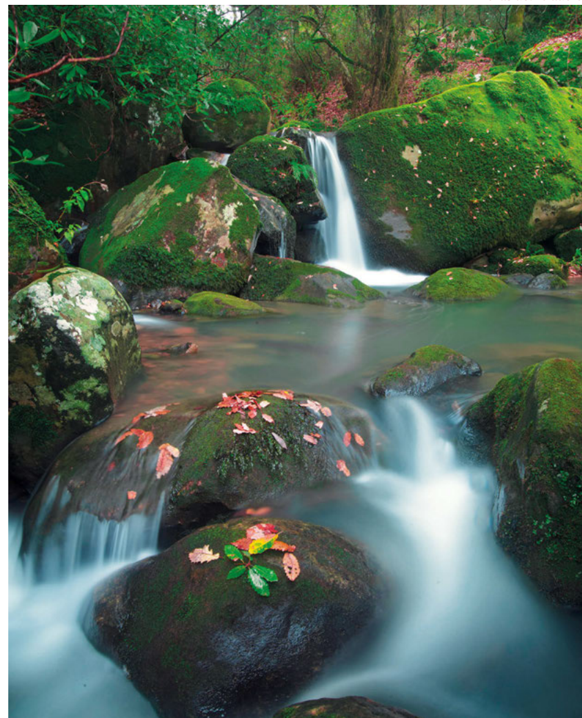
Pozas del Tiradero.

El acceso por la antigua carretera CA-221 precisa de permiso y de reserva de sus días exclusivos de apertura. Solicitar formulario y fechas hábiles en: pn.alcornocales.cmaot@juntadeandalucia.es . Información en Tel 856 587 508.